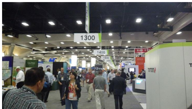
写真 2 展示ブースの様子