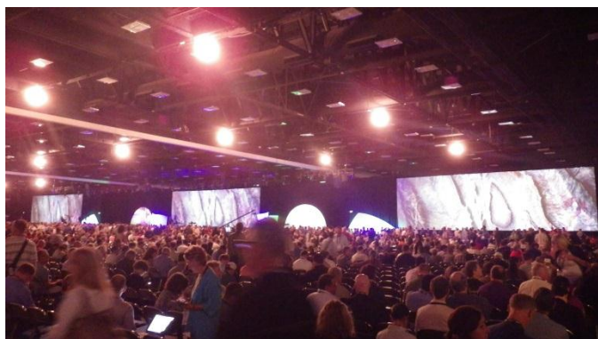
写真 1 開会式の様子

2013 年の米国 Esri ユーザ会は 7 月 8 日（月）～12 日（金）の日程で開催されました。米国 Esri 社社長 ジャック・デンジャモンド氏による挨拶で盛大にスタートしました（写真 1）。本年度は「GIS-Transforming Our World」をテーマに、基調講演、ArcGIS10.2 の紹介、世界各国における革新的で、多岐に渡る GIS 活用事例の紹介やテクニカルワークショップが繰り広げられました。また広大な展示ブース（写真 2）では、米国 Esri 社、スポンサー企業、NPO 団体等による展示が行われました。このように米国 Esri ユーザ会は GIS の現状や今後を知る上で貴重な機会となっています。