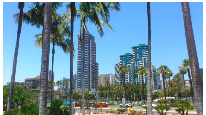
写真6 サンディエゴの街並み

米国Esriユーザ会は毎年カリフォルニア州サンディエゴ市(写真6)で開催されています。7月のサンディエゴ市は日本の真夏のような蒸し暑さもなく、過ごしやすい気候でした。会場であるサンディエゴコンベンションセンター(写真7)は非常に利便性の高い場所に位置しています。徒歩でサンディエゴ市内のレストランに行くことが出来るため、多くのユーザが午前中の各セッションで知り合った方々と一緒に昼食に出かける姿が見受けられました。参加者にとっては、GISの現状や今後を知れるだけでなく、このサンディエゴで5日間過ごすことが出来るというのも大きな魅力の1つだと思います。