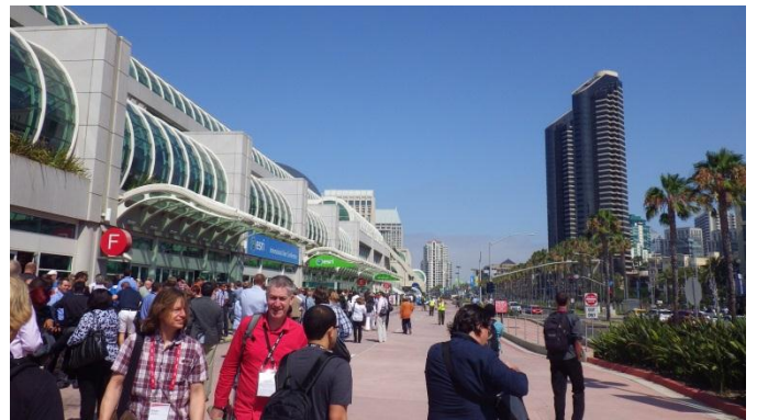
写真7 会場付近の様子