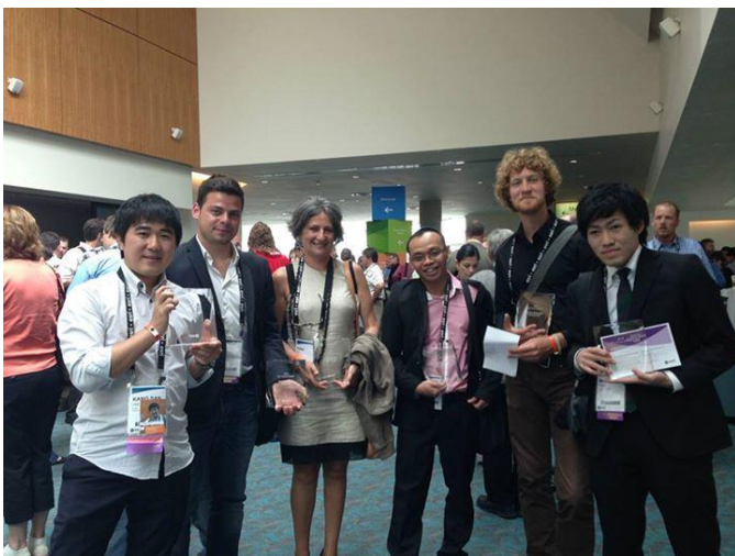
写真5 Esri Young Scholars Award受賞者と