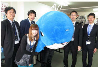
高度情報推進のみなさん

地理的オープンデータの公開に特化した仕組み、「ArcGIS Open Data」を全国に先駆け活用情報の透明性維持を、「的確な意思決定」、「わかりやすいルール」、「使いやすい仕組み」で具現化